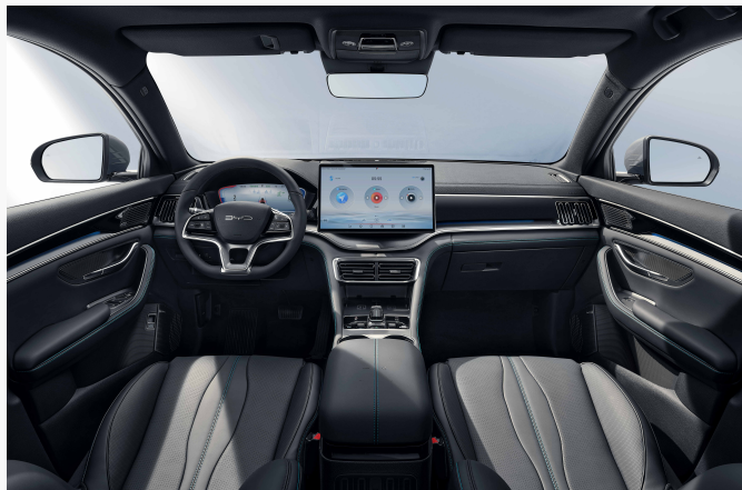
Black & Brown