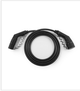
Laadkabel type 2 mode 3 (max 32 A / 1 fase) - 7,5 m.